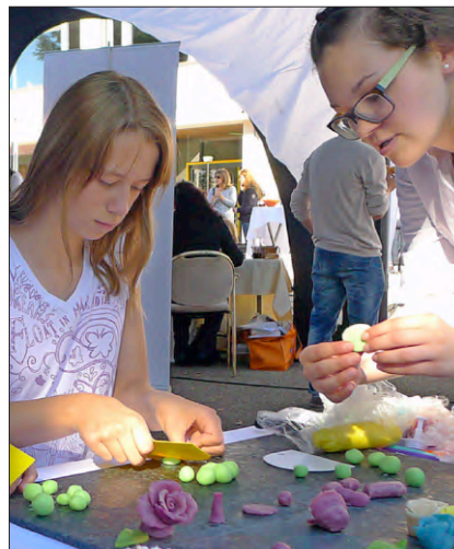
Aus Marzipan wird Tischdeko

Die zweite Trumpfkarte ist die Möglichkeit, erste praktische Handgriffe zu machen. In einem Workshop von Mesa Parts und WST etwa dürfen Schüler einen (so heißt das wirklich) Eierschalensollbruchstellenverursacher bauen, mit dem man beim Frühstück wunderbar einfach