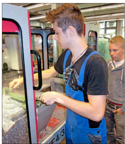
Aufmerksam verfolgt der Schüler, wie ein Azubi Späne handhabt.

Fotos von der Jobstartbörse unter mehr.bz/jobstartboerseneustadt