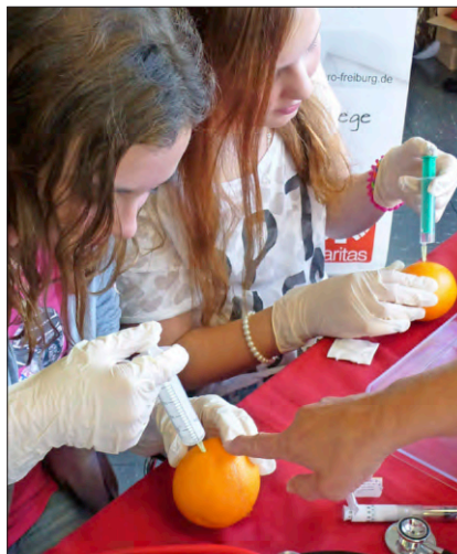
Eine Injektion setzen

jungen Leute am besten überzeugt. Ob Technocell aus Neustadt, IMS Gear und Framo Morat aus Eisenbach, ob Testo und Mesa Parts aus Lenzkirch, WST Präzisionstechnik aus Löffingen – sie sind mit ganzen Teams gekommen.