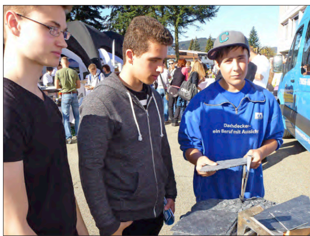
Ein Dachdecker zeigt Schülern, wie man aus Schiefer Ziegel schlägt.